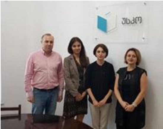
უსკოს თანამშრომლებისა და დემოკრატიისა და საარჩევნო ხელშეწყობის საერთაშორისო ინსტიტუტის( IDEA) წარმომადგენლის შეხვედრა. 2018 წ.