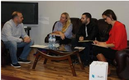
IRI-ს დამკვირვებლები უსკოში. 2016 წ.