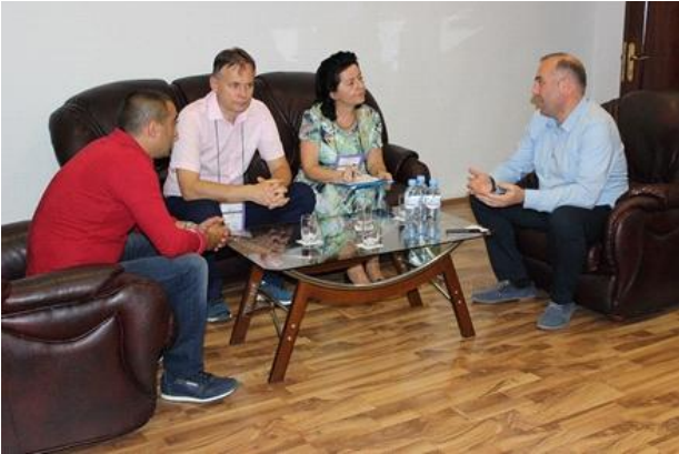
საარჩევნო კომისიის თავმჯდომარისა და პოლონეთის რესპუბლიკის სეიმის დეპუტატების შეხვედრა. 2016 წ.